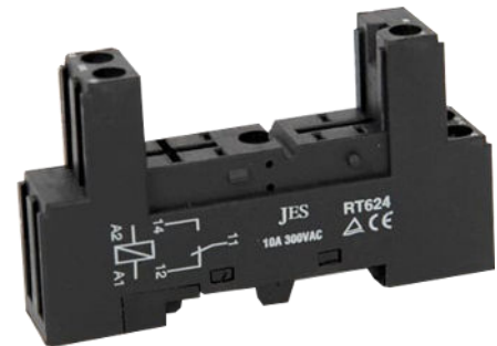
Βάση για Ρελέ TNA